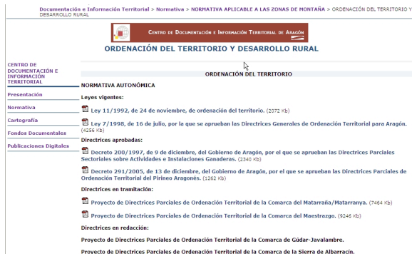
Figura 3. Normativa.