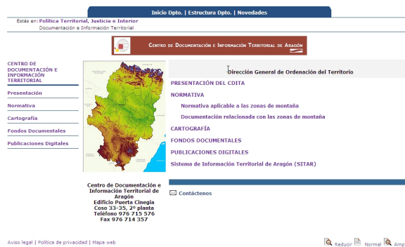
Figura 1. Página principal del Centro de Documentación e Información Territorial de Aragón.

Uno de los resultados de la planificación descrita con anterioridad es la incorporación, en noviembre de 2007, de los contenidos desarrollados por el CDITA en el Portal del Gobierno de Aragón en Internet. A continuación se describen dichos contenidos.