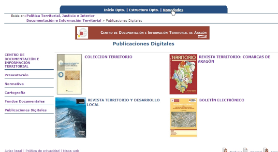
Figura 7. Publicaciones digitales.