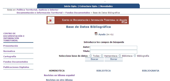
Figura 6. Base de datos bibliográfica.

También se accede desde aquí a la Guía de recursos cartográficos, documentales y de internet del Centro de Documentación e Información Territorial que se realizó en el año 2005 (figura 6).