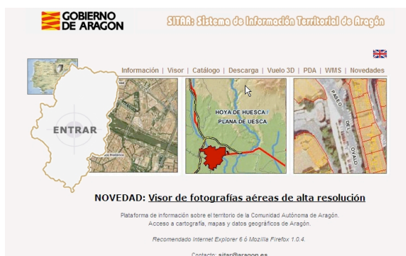
Figura 5. Página principal del Sistema de Información Territorial de Aragón (SITAR).