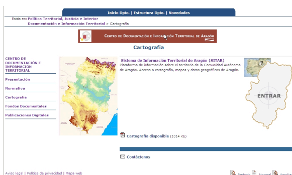
Figura 4. Cartografía.

Contiene una descripción de la cartografía disponible en el Centro, una relación de los distintos servicios cartográficos que pueden solicitarse y un enlace directo al Sistema de Información Territorial de Aragón (SITAR) (figuras 4 y 5).