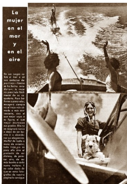
Figura 5. La mujer en el mar y en el aire, 7 de agosto de 1935

La mujer estuvo más presente dentro de las páginas de deporte que en las de cultura: hockey, tenis, natación, etc., con un montaje moderno en la página titulada “La mujer en el mar y en el aire” (7 de agosto de 1935, Figura 5). Incluso en este apartado el trato que se le da es cuestionable, como se observa en el artículo dedicado a la aviadora Helène Boucher, fallecida el 30 de enero de 1934 en un accidente aéreo cerca de Versalles, en el que el periodista Ceferino R. Avicilla escribió: “Es guapa. Por eso se seguían sus aventuras con tanto interés y tanta emoción” (16 de enero de 1935).