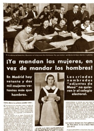
Figura 9. Portada alusiva al voto femenino, 22 de enero de 1936