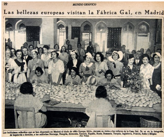
Figura 3. Visita de las misses de Europa a los talleres de la fábrica Gal, 31 de mayo de 1933

Una información gráfica de especial significado fue la visita de las misses de varios países a los talleres de la fábrica Gal, en un contraste social que muestra a “las bellísimas señoritas que se disputan en Madrid el título Miss Europa 1933” junto a las obreras encargadas del estuchado de la cosmética (31 de mayo, Figura 3).