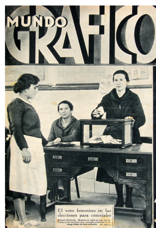
Figura 8. Mujeres votando en Moncada (Valencia), 26 de abril de 1933