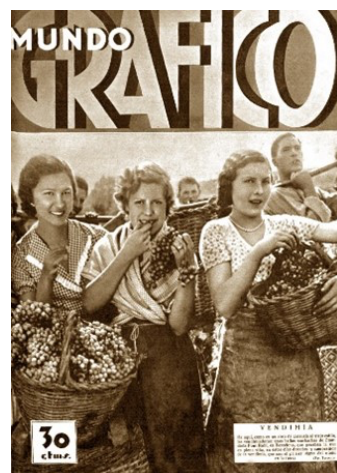
Figura 7. Vendimiadoras, 19 de septiembre de 1934,

con un titular relevante: "¡Ya mandan las mujeres en vez de mandar los hombres!" (Figura 9).