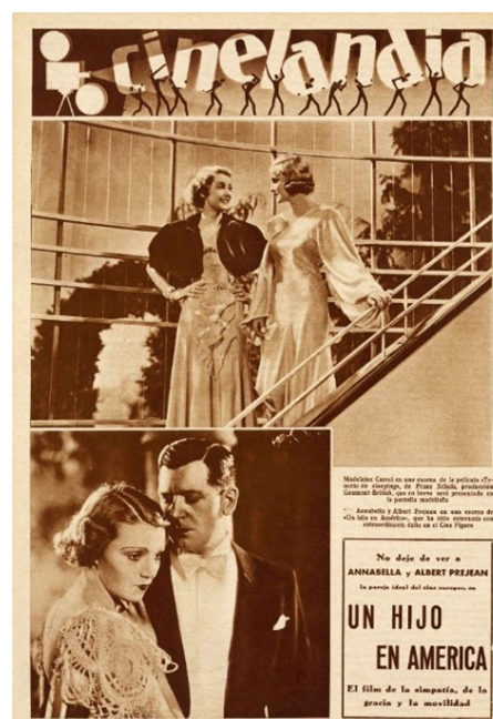
Figura 1. Sección “Cinelandia”, 28 de febrero de 1934

El análisis global que se realiza es el primer resultado de un proyecto que contempla posteriores estudios en otras relevantes publicaciones ilustradas de información general. Siguiendo un orden cronológico, se han recuperado las informaciones gráficas de la revista entre abril de 1931 y julio de 1936, con un primer resultado que determina la concentración de imágenes sobre la mujer en tres secciones: “Cinelandia” (cine; Figura 1), “Farsas y farsantes” (teatro) y “Páginas de la mujer” (moda).