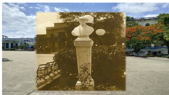
Figura 8. Busto a Padre Chao

Enviado: 2022-04-08. Segunda versión: 2022-06-04. Aceptado: 2022-06-08.