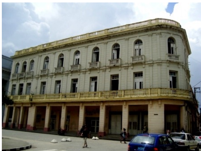
Hotel Florida, Café y Teatro Villaclara. 2016. Arquitectura Social. Imagen actual del edificio, tras la ampliación del hotel en 1939 hacia la parte que ocupaba el café Villaclara, manteniendo en su planta baja dicho servicio. Positivo. Digital. 1024 x 620