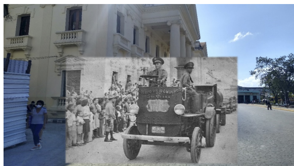
Figura 5. Desfile del Cuerpo de Bomberos de Santa Clara