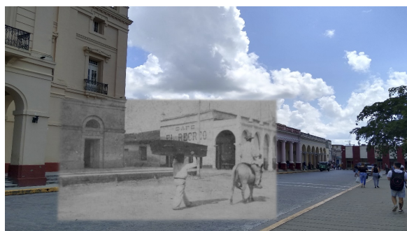
Figura 6. Servicios Funerarios