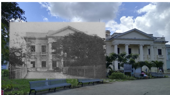
Figura 3. Construcción del Palacio de Gobierno