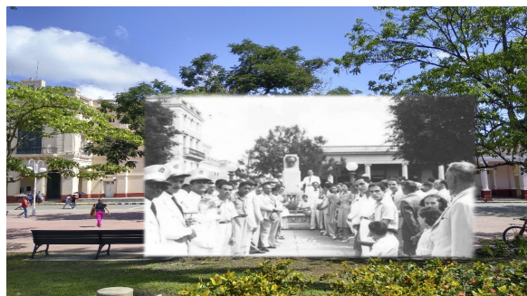
Figura 7. Rincón Martiano