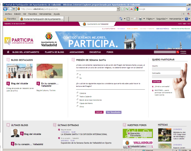
Figura 3. Imagen del portal de participación del Ayuntamiento de Valladolid

Junto a estos blogs publicados desde el propio Ayuntamiento de Valladolid, también se incorpora un nuevo concepto, denominado planeta de blogs, que permite la publicación de otros blogs externos dentro del propio portal web municipal.